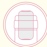
Bouchon Cork stopper