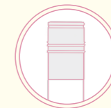
Fermeture BVS disponible en diverses finitions BVS closure available in different finishes