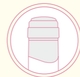
Capsule PVC PVC capsule