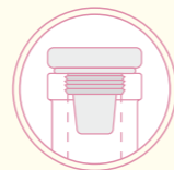
Vinolok Vinolok stopper