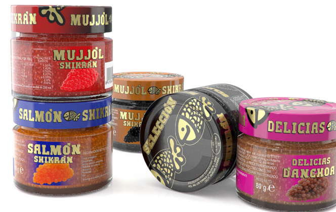
Euro Caviar Murcia

Nuestra propuesta es amplia (desde la creación de marca e imagen, hasta un tarro personalizado y todos los componentes que lo complementan). Contamos con innumerables proyectos que hoy son realidad, y que hemos desarrollado desde una incipiente idea, que mediante un servicio integral, hemos puesto en las manos de los amantes de los productos de calidad con un tarro exclusivo, identificativo en cualquier lineal de un supermercado o en tu restaurante favorito, con una cuidada imagen gráfica, con un equilibrio en todos los componentes del envase. Un producto único, se merece un envase único y un equipo de profesionales expertos único, como el de Studio One Eleven . Ven y conócenos.