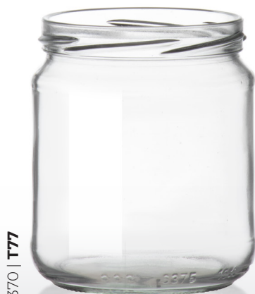
370 | T77