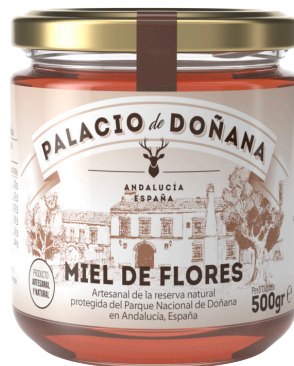
Palacio de Doñana Sevilla