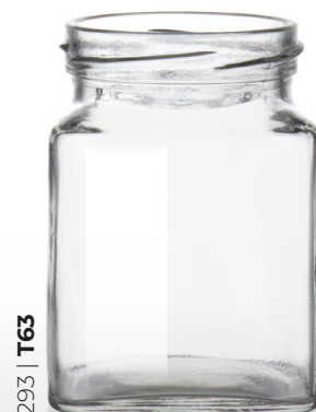
293 | T63