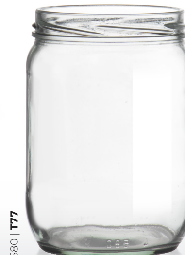
580 | T77