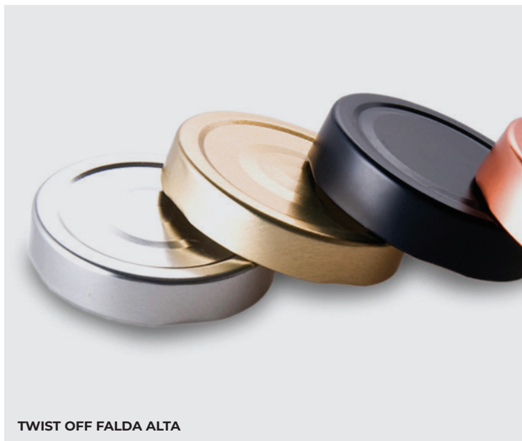
TWIST OFF FALDA ALTA