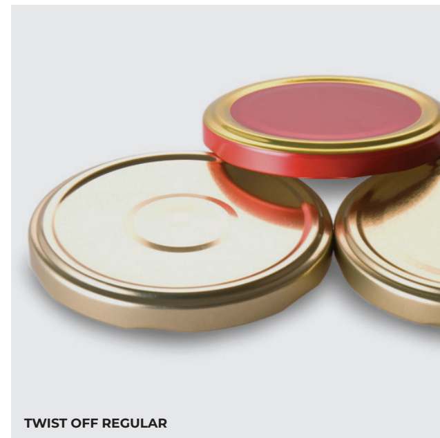
TWIST OFF REGULAR