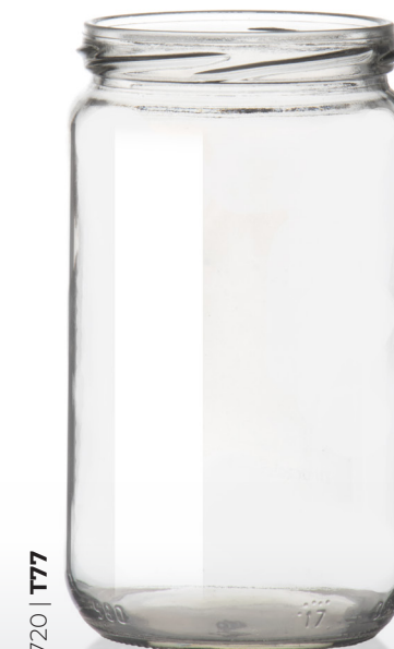
720 | T77