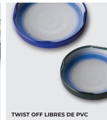
TWIST OFF LIBRES DE PVC

ES Berlin Packaging sigue y asesora a sus clientes en la personalización de los cierres: desde la elección del material hasta los diferentes tipos de elaboración para obtener un resultado que garantice la correcta conservación del contenido, con una particular atención al aspecto estético.