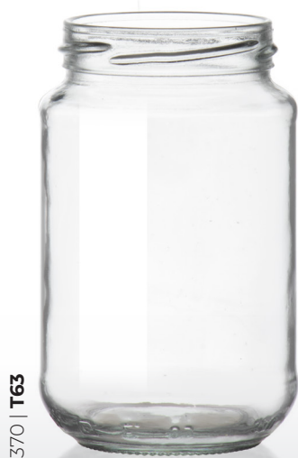
370 | T63