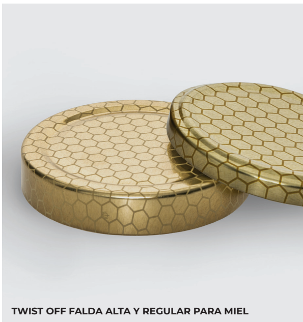
TWIST OFF FALDA ALTA Y REGULAR PARA MIEL