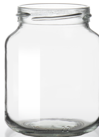
370 | T66