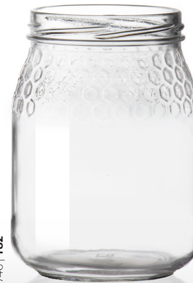
746 | T82