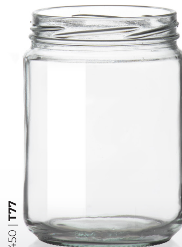
450 | T77