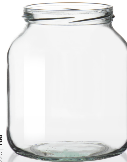
720 | T66