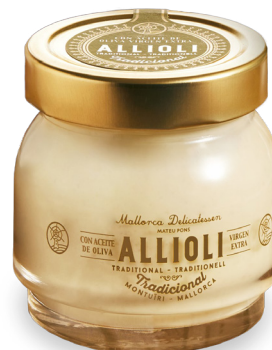
Mallorca Delicatessen Mallorca