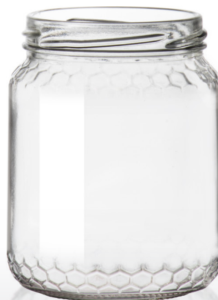
390 | T70