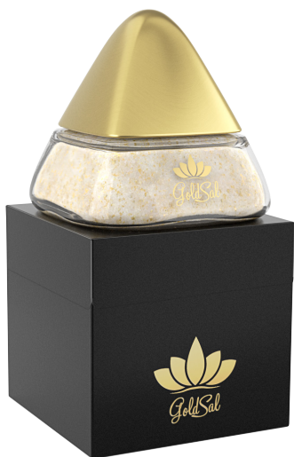
Gold Sal Cádiz

En Studio One Eleven nos encargamos de acercar tu producto de forma sencilla a tu cliente con un posicionamiento acorde a los valores que quieres transmitir. Él se sitúa en el centro de nuestras decisiones haciendo del diseño e innovación una atractiva oferta visual y práctica. Tu cliente es nuestra inspiración y la razón por la que pensamos que un buen proyecto debe ser determinante para que le conquistes. Porque sabemos que cuidas tu producto desde su origen, nosotros como especialistas en packaging aplicamos nuestra experiencia dilatada en el sector a tu envase. Tú sueña y nosotros nos encargaremos de hacerlo realidad.