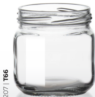
207 | T66