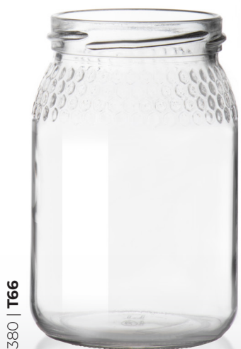
380 | T66