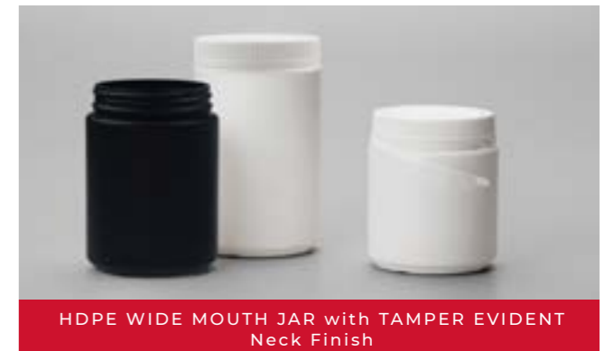
HDPE WIDE MOUTH JAR with TAMPER EVIDENT Neck Finish

Gama desde los 600 ml hasta los 1.500 ml.