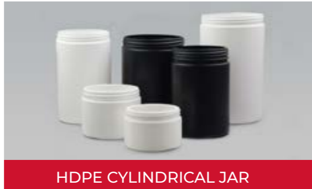
HDPE CYLINDRICAL JAR

La gama de tarros cilíndricos de HDPE. Los tamaños con cuello de 100 mm y 120 mm están disponibles con o sin reborde. Es perfecto para utilizar los cierres Long Skirt para crear un efecto cilíndrico completo.