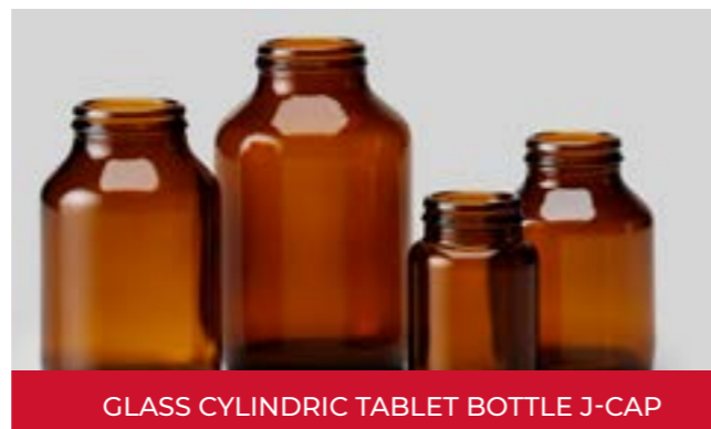
GLASS CYLINDRIC TABLET BOTTLE J-CAP

Los frascos rectos para comprimidos de tipo III con acabado de cuello J-Cap son la solución de envasado tradicional para vitaminas y suplementos nutricionales en forma de píldora o comprimido. Esta línea requiere cierres J-Cap GCA..