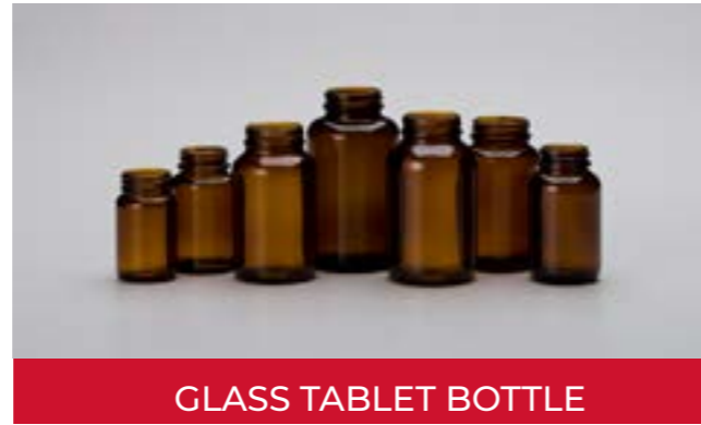
GLASS TABLET BOTTLE

Los frascos de vidrio ámbar de tipo III son una solución para envasar suplementos nutricionales en forma de pastillas o cápsulas.