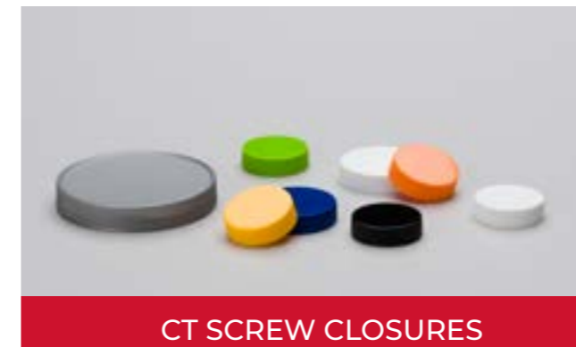
CT SCREW CLOSURES