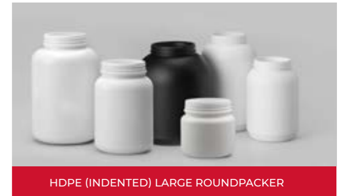
HDPE (INDENTED) LARGE ROUNDPACKER

Gama desde los 1.700 ml hasta los 8.000 ml.