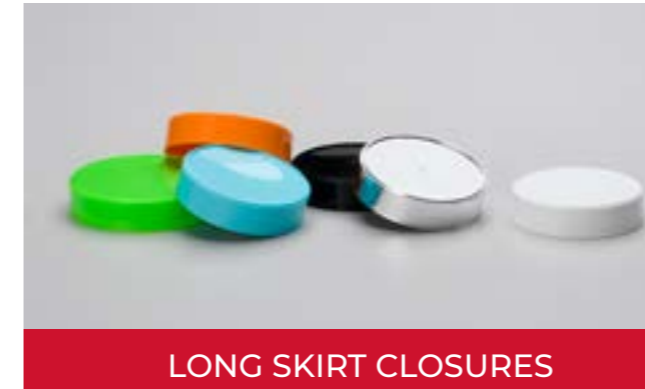
LONG SKIRT CLOSURES